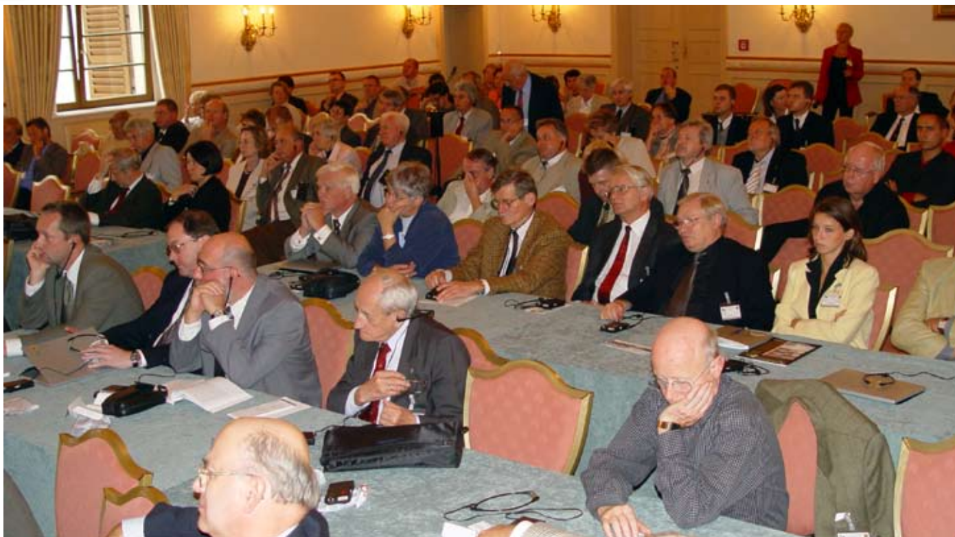
Na sali obrad. Miśnia 2003 r.