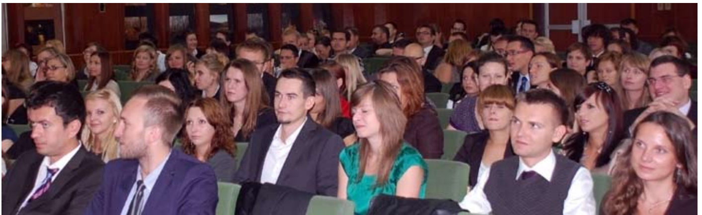
W uroczystości wzięło udział ok. 80. lekarzy stażystów. Tak wysoka frekwencja miło zaskoczyła organizatorów.

Przed absolwentami Wydziału Lekarskiego AM we Wrocławiu roczny staż podyplomowy. Nie pozostaje nam nic innego, jak życzyć młodemu adeptom sztuki lekarskiej powodzenia i wielu sukcesów.