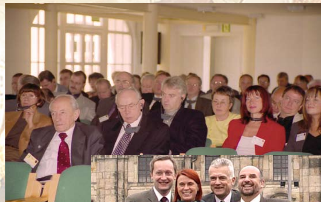
Uczestnicy konferencji w Krzyżowej, 2001 r.