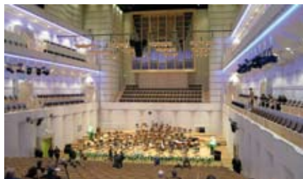
Filharmonia w Dortmundzie

więcej czasu pacjentom i został wyróżniony nagrodą kraju związkowego Nadrenii-Westfalii za innowację. W nowoczesnych pomieszczeniach Kliniki Westfalen powstały interdyscyplinarne centra leczenia raka piersi, jelit, prostaty i płuc, oferujące diagnozę i terapię pod jednym