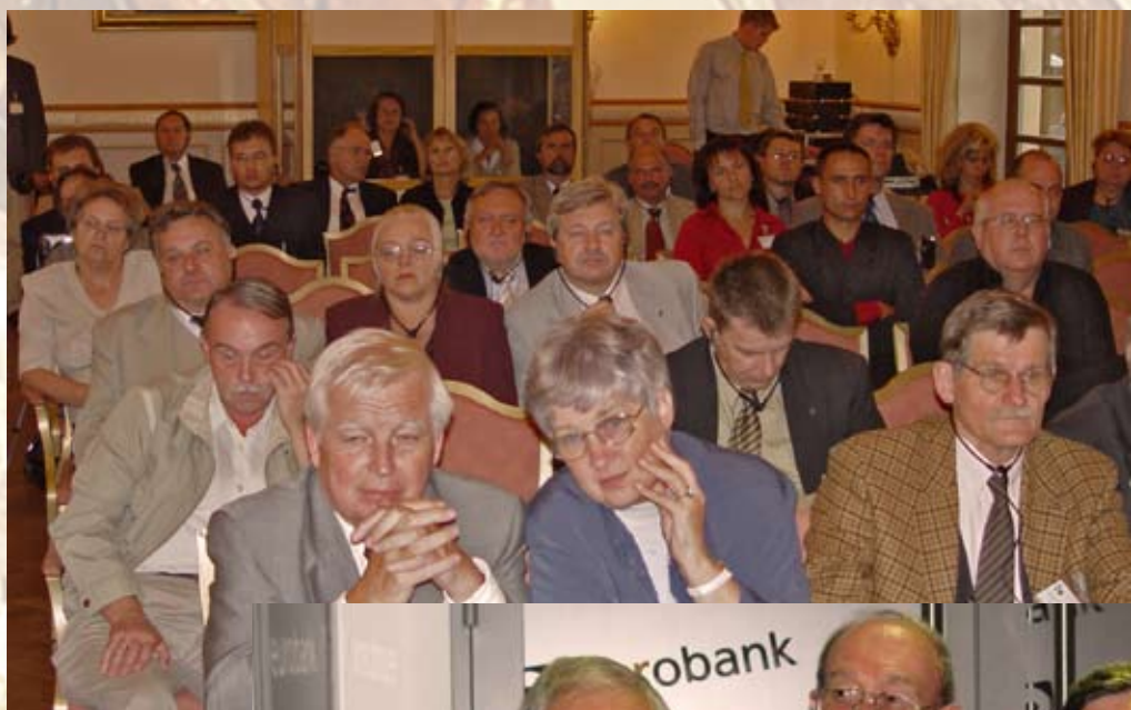
Na sali obrad, Miśnia 2003 r.