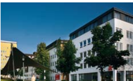
Szpital bractwa górniczego w Dortmundzie

dachem. Do dyspozycji jest dostępna najnowocześniejsza technika – m.in. zrobotyzowany system chirurgiczny daVinci w Klinice Akademickiej. Studia z możliwością kontaktu z pacjentami wliczają się do zadań Cancer Center w Klinice Westfalen, pierwszego centrum onkologicznego w Nadrenii-Westfalii. „W Klinice Westfalen – mówi dyrektor ds. medycznych