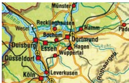
Mapa Zagłębia Ruhry

Pod koniec XIX w. wietysięćmieszkańców Górnego Śląska i Polski chciało przenieść się do Zagłębia Ruhry. Migrowali z powodu tutaj lepszych warunków pracy, budowali kopalnie i stalownie i dobrze im się żyło – największe huty stali i kopalnie były wtedy europejską „Doliną Krzemową”. Węgiel i stal