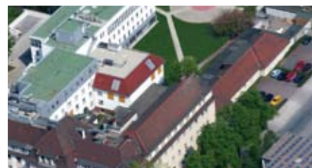
Klinika przy parku Lünen-Brambauer