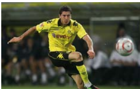
4 marca 2011: Robert Lewandowski strzela 1:0 w meczu z 1. FC Köln.