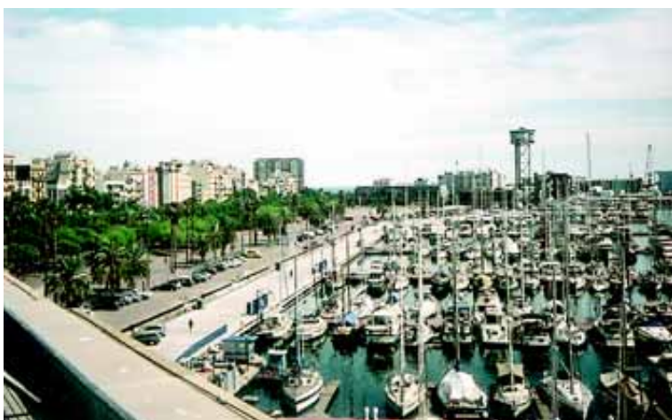
Każdy lekarz w Barcelonie ma przynajmniej jedną żaglówkę.