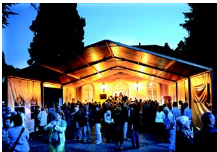
Dworek Chopina. Po koncercie.