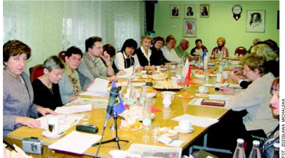
Posiedzenie Komisji Stomatologicznej.