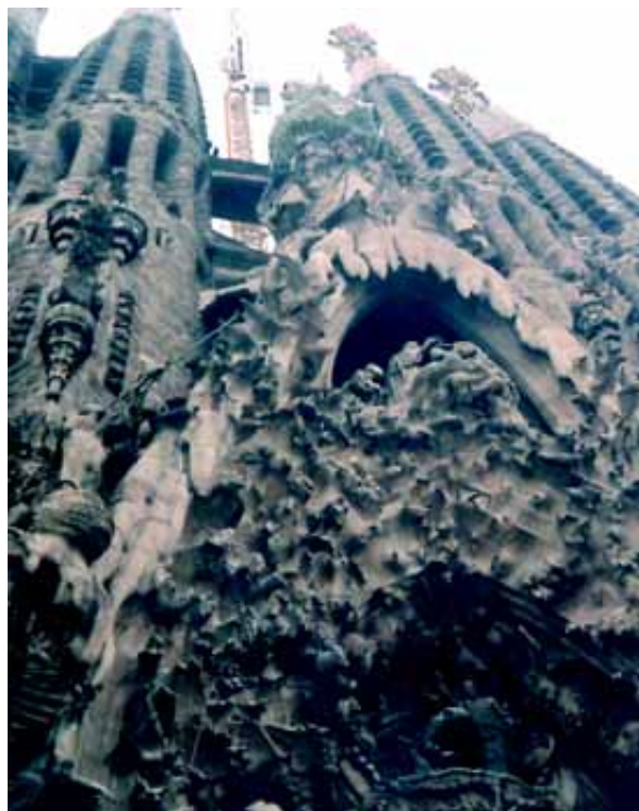
Ciągle w budowie świątynia Świętej Rodziny projektu A. Gaudiego.