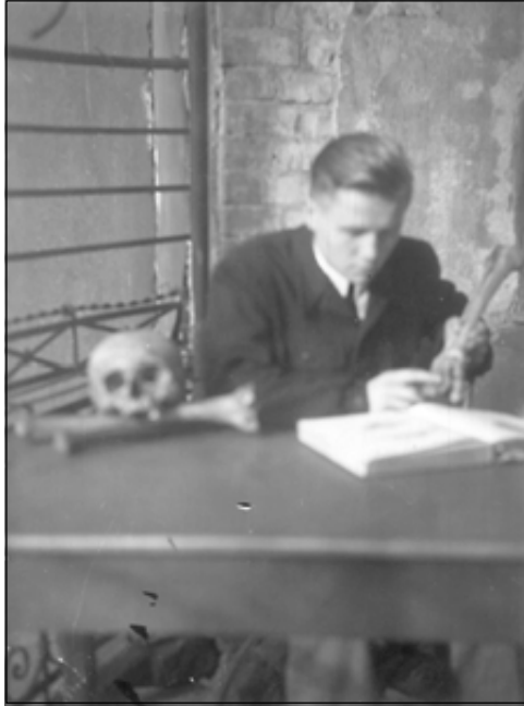
Przygotowania do egzaminu.

Do Wrocławia trafił właściwie przez przypadek. Tam wyjechali bowiem jego koledzy. W roku 1951 rozpoczął studia na Wydziale Lekarskim. Od trzeciego roku utworzono oddział Pediatriczny, co wiązało się z dodatkowymi zajęciami z pediatrii. Studia ukończył w 1957 roku i otrzymał dyplom lekarza medycyny ze specjalizacją I stopnia z pediatrii. W trakcie studiów w latach 1956-1957 działał w grupie Starszoharcerskiej,