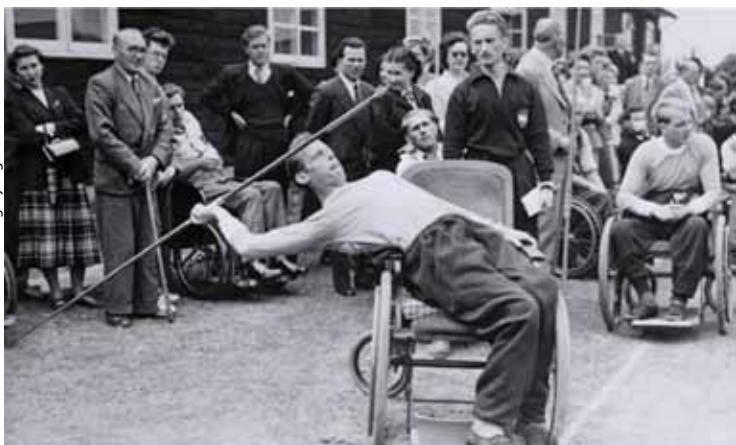
Łuczniczcy ze Stoke Mandeville