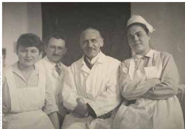
Ludwig Guttmann i Otrifrid Foerster