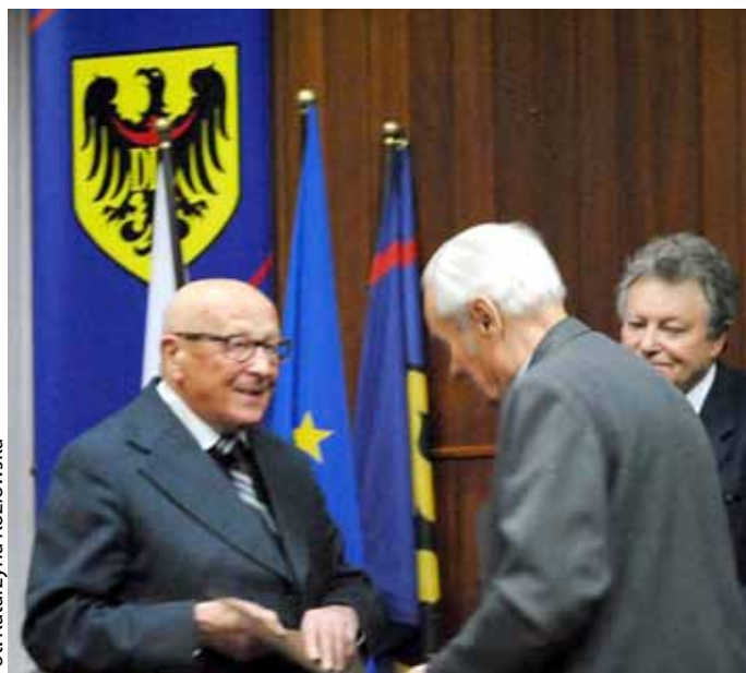
Fot. Katarzyna Kozłowska