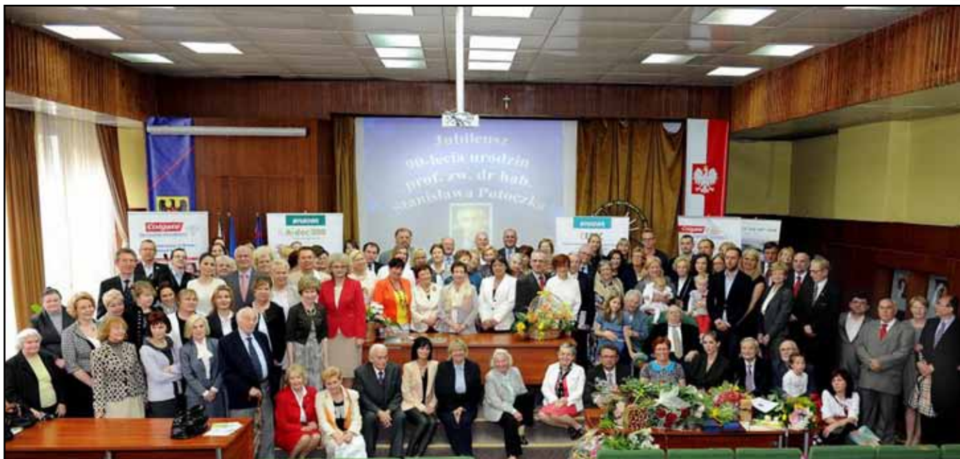
Uczestnicy jubileuszowego spotkania