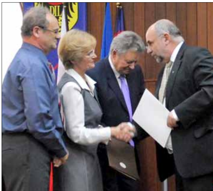
Prezes DRL składa gratulacje nagrodzonym.