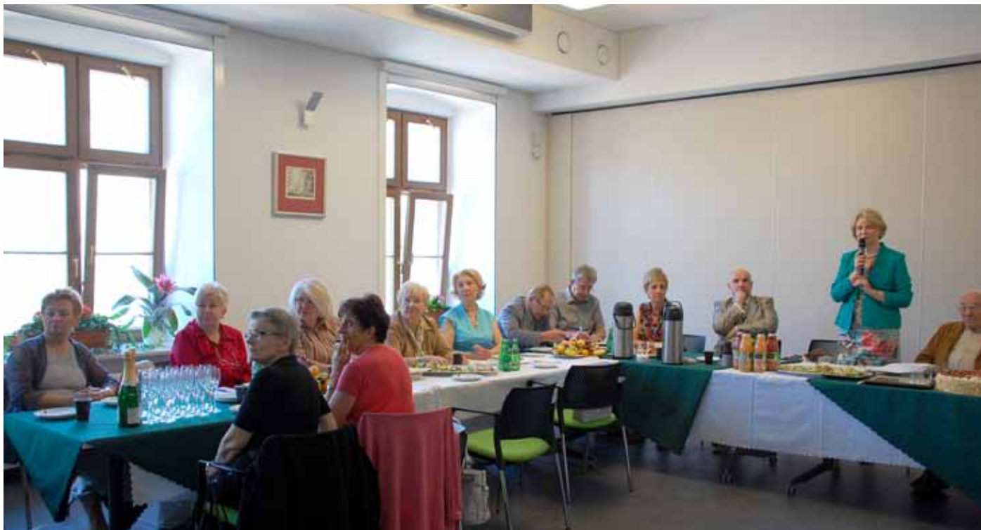
Członkowie Komisji Stomatologicznej DRL dyskutowali o problemach, z jakimi przyjdzie im zmierzyć się w tym roku.

Zespół ds. kontaktów z NFZ przedstawił opracowanie dotyczące konieczności rezygnacji z ujemnej punktacji za efekty kontroli przy kontraktowaniu świadczeń stomatologicznych. Uzasadnił to następująco: