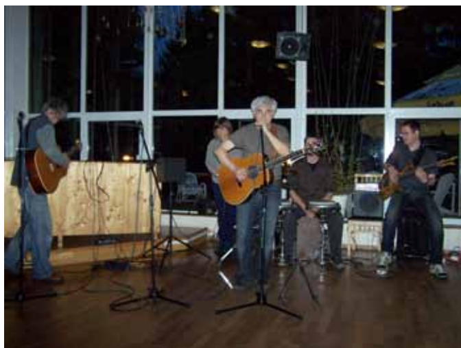
Wolna Grupa Bukowina