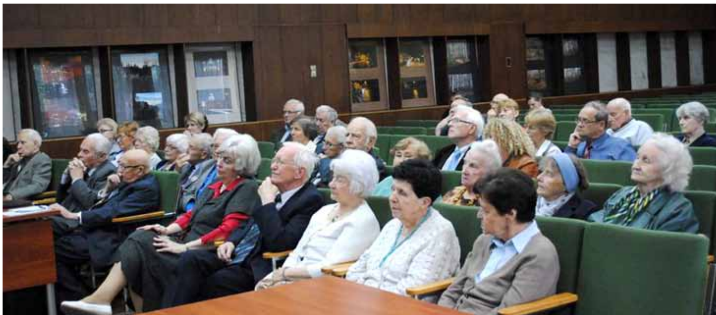
Uczestnicy 88. Spotkania Klubowego u Medyków, sala konferencyjna DIL przy al. Matejki 6