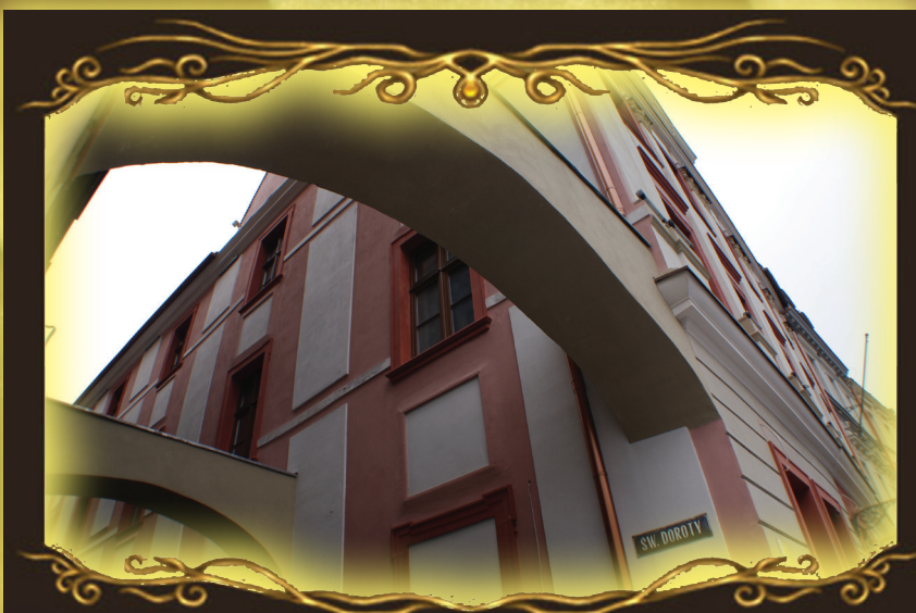
Dom Lekarza od strony ul. św. Doroty