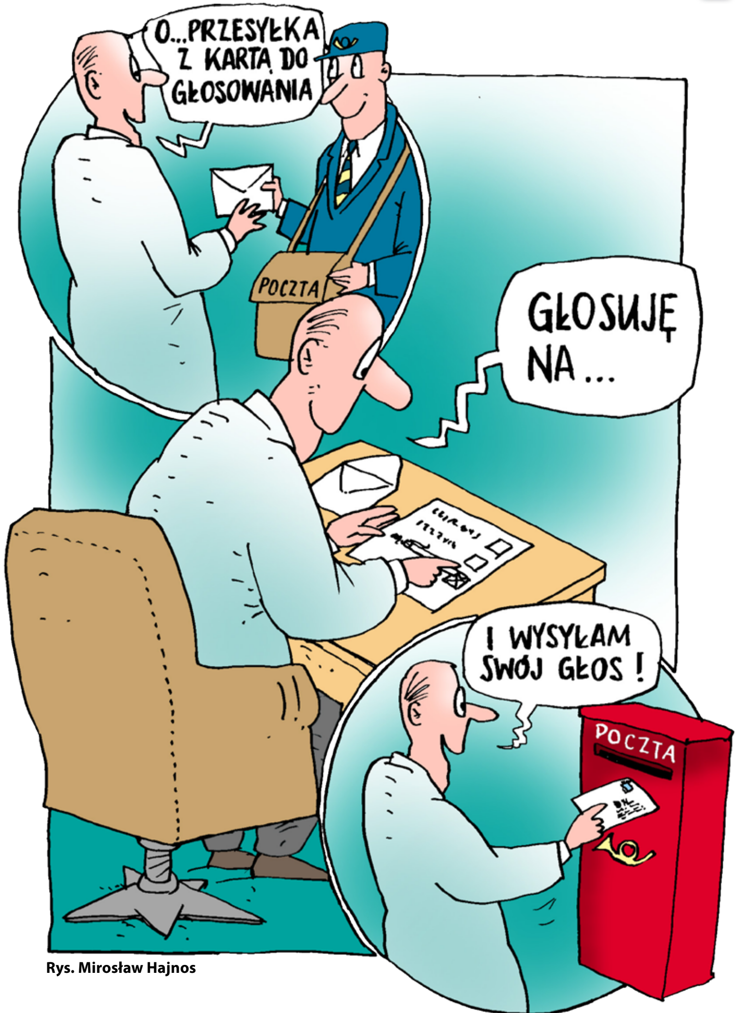
Rys. Mirosław Hajnos