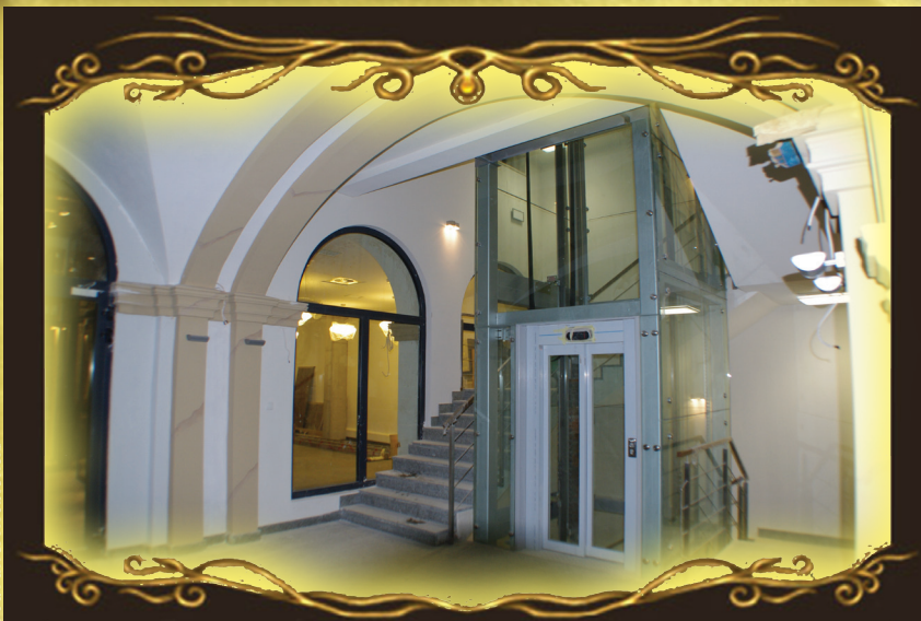
Hol główny nowej siedziby