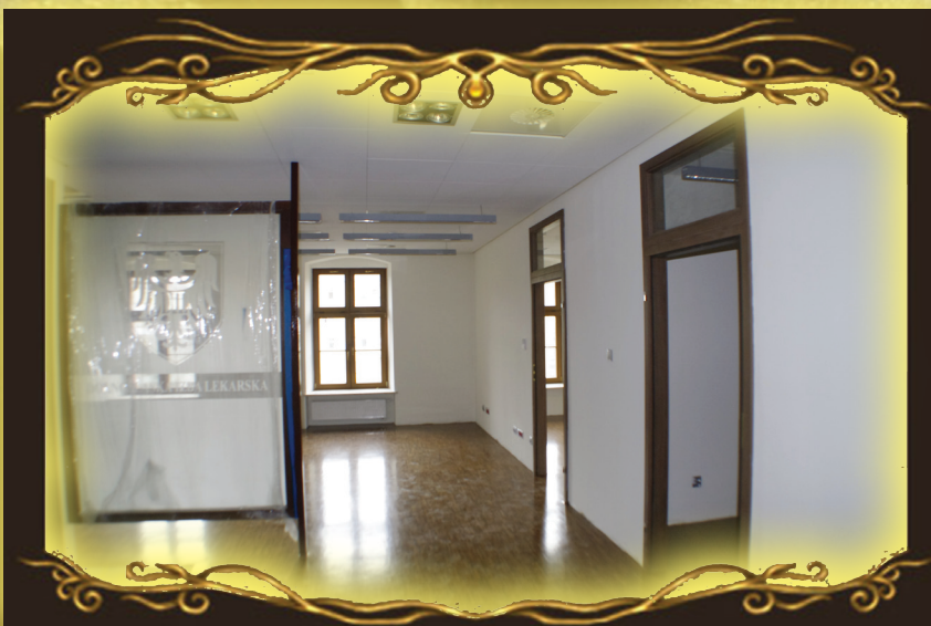
Przyszły sekretariat Izby