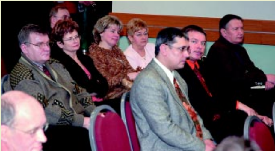
Na sali obrad w trakcie Walnego Zgromadzenia.

Motorem dla powstania Związku Pracodawców Ochrony Zdrowia Dolnego Śląska stały się problemy z kontraktowaniem usług medycznych na 2004 rok, jego celem zaś integracja środowiska świadczeniodawców. O tym, że wspólnie łatwiej jest rozwiązywać problemy, przekonani byli uczestnicy zebrania ogólnego związku, które odbyło się 18 marca w hotelu „Wrocław”.