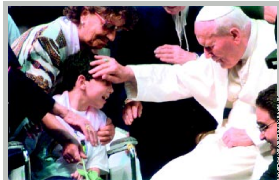
Jan Paweł II do końca swoich dni uczył nas, jak żyć, jak kochać, jak się modlić. Pamiętajmy o Jego nauce.