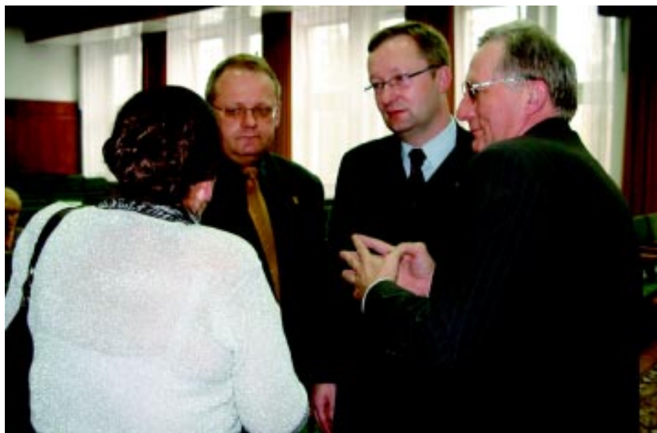
Dyskusja w przerwie obrad zjazdu.