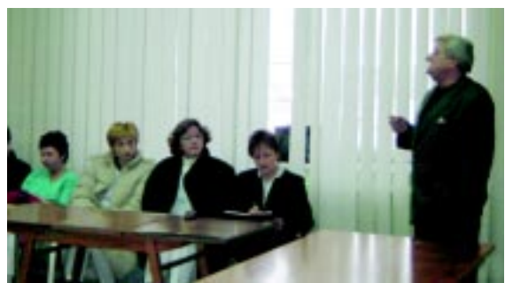
Spotkanie w Kłodzku.

W tym roku postanowiliśmy tak się zorganizować, aby przebieg informacji był szybki i skuteczny, aby każdy miał dostęp do ustawicznych szkoleń bez względu na miejsce zamieszkania i pracy, aby każdy lekarz mógł liczyć na wsparcie i pomoc naszej korporacji. Odwiedziłam kolegów w Bielawie, Świdnicy, Bystrzycy, Łądku Zdroju, Polanicy Zdroju i Kłodzku. Te tereny najbardziej dotknięta wadliwa restrukturyzacja. Szpitale powiatowe są chyba w najgorszej kondycji finansowej, mają najwięcej problemów