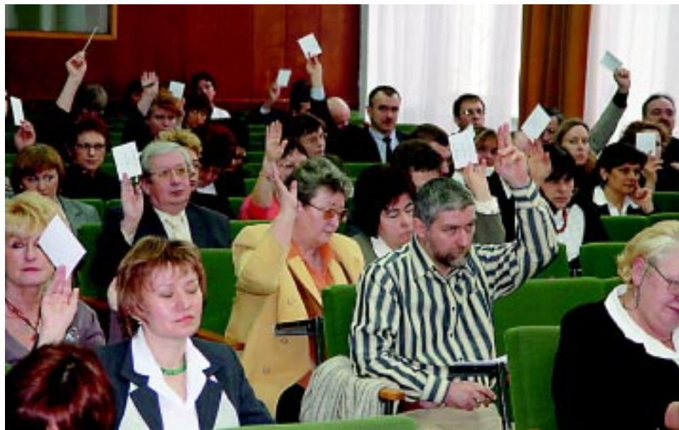
Głosowanie nad przyjęciem budżetu.